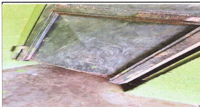
Foto 3: en esta fotografia se evidencia las puertas en pesima condiciones