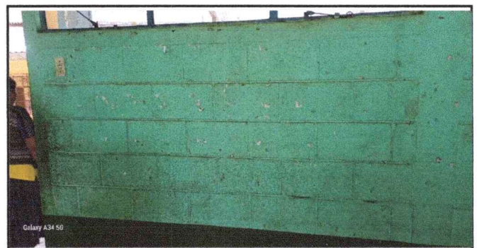
Foto 6: la necesidad de aplicacion de pinturas interior e exterior

Observación: Si es necesario se pueden agregar hojas adicionales y actualizar el número de hojas.