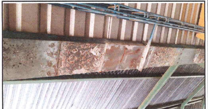
Foto 2: se observa la necesidad de sustitucion del soporte de la estructura