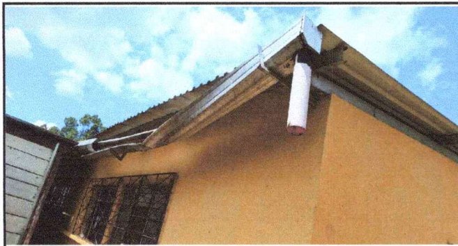
Foto1: Se evidencia la necesidad de sustitucion de canales